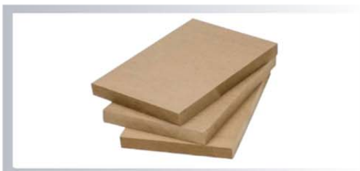
ไม้ MDF BOARD (Medium Density FiberBoard) หนา 2.5, 4, 6, 9, 15, 25 มิลลิเมตร