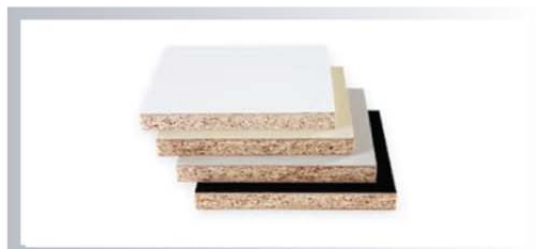
ไม้ปาติเกิลบอร์ด เกรด E1 ปิดผิวด้วยเมลามีน (Particle Board) หนา 9, 12, 16, 18, 25 มิลลิเมตร