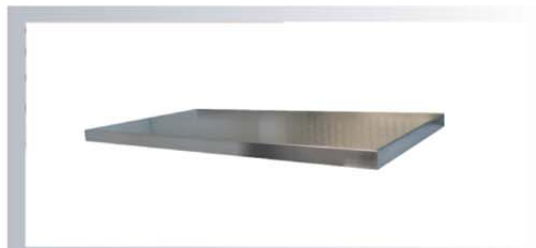
สแตนเลสสตีล (Stainless steel) #304, #316, # 316L หนา 1.0, 1.2, 1.5 มิลลิเมตร