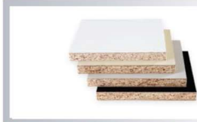
ไม้ปาติเกิลบอร์ด เกรด E1 ปิดผิวด้วยลามิเนท (Particle Board) หนา 9, 12, 16, 18, 25 มิลลิเมตร