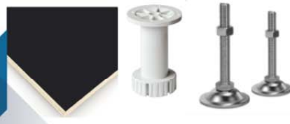
ขาตู้พลาสติก ABS