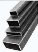
โครงสร้างโต๊ะเป็นเหล็กกล่องสีเหลี่ยมผืนผ้า 2" x 1" หนา 2.0 มม. เคลือบสี Epoxy