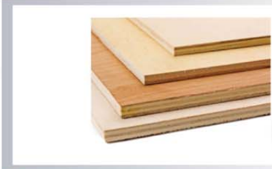
ไม้อัด (Plywood) หนา 6, 10, 15, 20 มิลลิเมตร