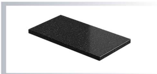
หินแกรนิต (Granite) หนา 14, 18, 20, 25, 30 มิลลิเมตร