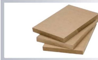
ไม้ MDF BOARD (Medium Density FiberBoard) หนา 2.5, 4, 6, 9, 15, 25 มิลลิเมตร