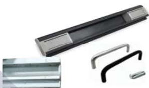
มือจับ PVC Grip Section C type Handel, Extruded Aluminium ผิว Anodize