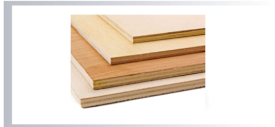
ไม้อัด (Plywood) หนา 6, 10, 15, 20 มิลลิเมตร