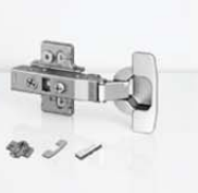
บานพับถ้าย ขนาด 35 มิลลิเมตร เป็นแบบ Soft close